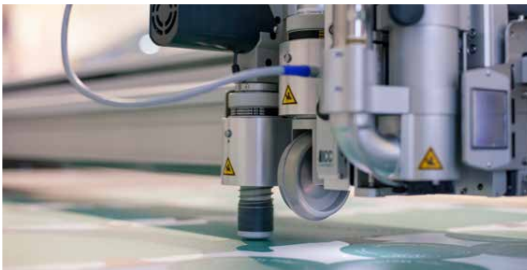
Máquina de corte y fresado de alta velocidad

"el equipamiento necesario para proporcionar un entorno altamente productivo"